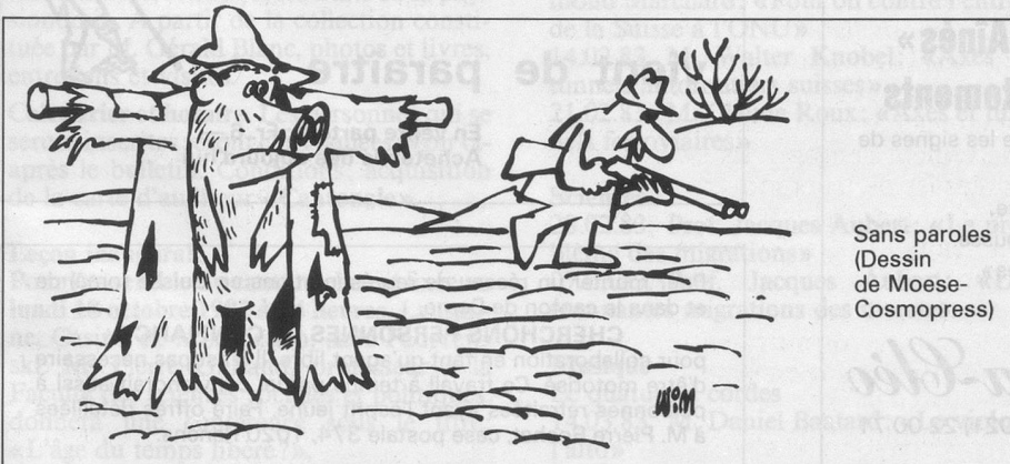
Sans paroles (Dessin de Moese- Cosmopress)

Un tiers, c'est beaucoup. Ça donne à réfléchir... E. H.