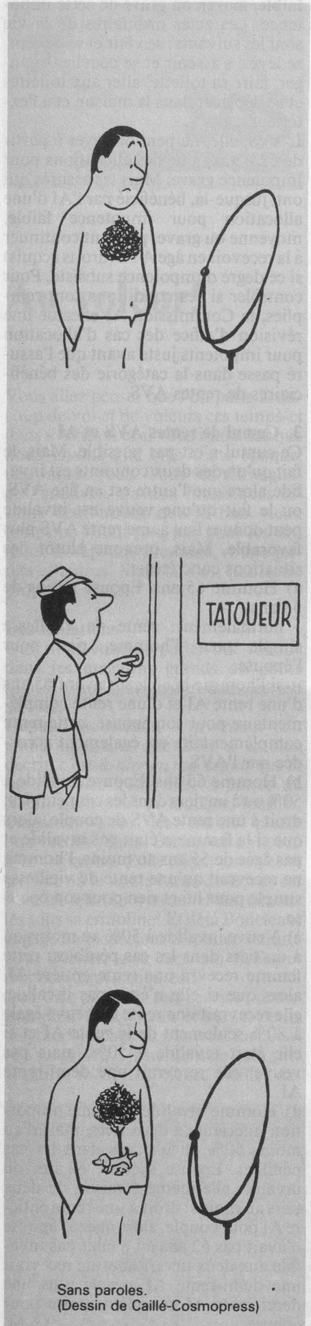
Sans paroles.

A la suite de quel indice l'inspecteur Bazot a-t-il pu faire avouer Mary Mist?.