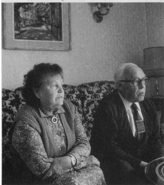
Mme Terrettaz: «Il ne va pas à la messe, mais il a gagné son paradis...»