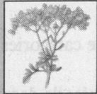
Rutine (ruta graveolens)