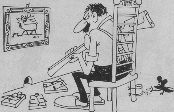
Sans paroles (Dessin de Moese-Cosmopress)

Dernier délai d'inscription: 15 juin 1982. Prix: Fr. 535.— tout compris, sauf boissons et dépenses personnelles.