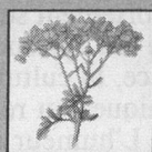
Rutine (ruta graveolens)