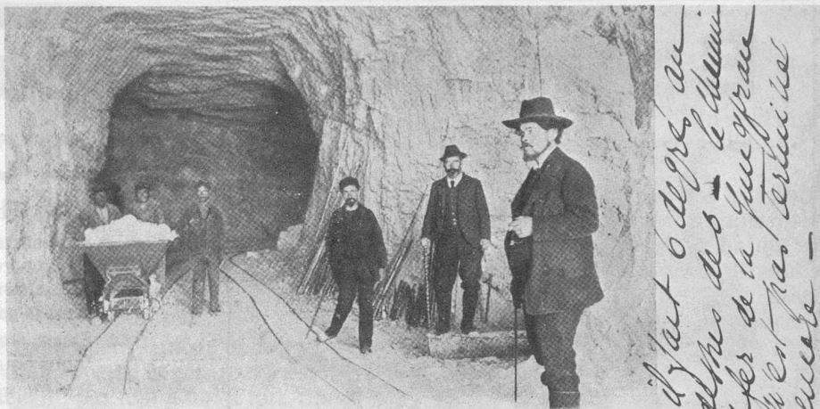
Ausbruch der Station Eigerwand. — Materialförderung durch den Hauptstollen.