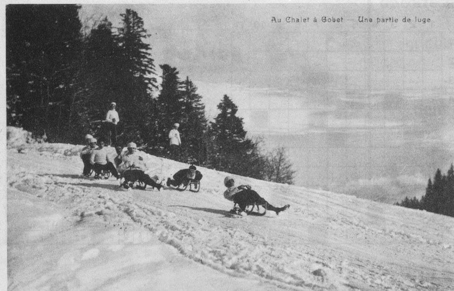
Au Chalet à Gobet — Une partie de luge

De tout temps, le Chalet-à-Gobet servit de station de sports d'hiver aux Lausannois, qui allaient patiner un peu plus loin, à Sainte-Catherine. Il n'y avait pas très longtemps que le tram du Jorat avait été mis en service et, grâce à ce moyen moderne de communication, les champs de neige et de glace étaient alors à proximité.