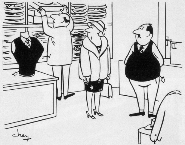
— Ce n'est pas le même modèle ou il a été tricoté à l'envers... (Dessin de Chen-Cosmopress)