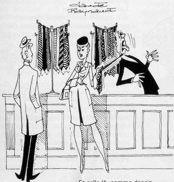
— Et celle-là, comme dessin, elle te plaît? (Dessin de Raynaud-Cosmopress)