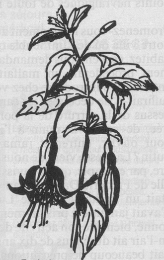
Fuchsias : rabattre les tiges à quelques centimètres.