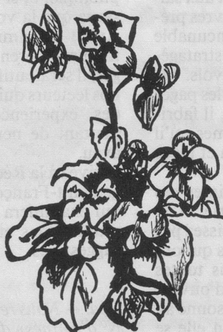
Bégonias : attendre la brûlure de la 1 re gelée.