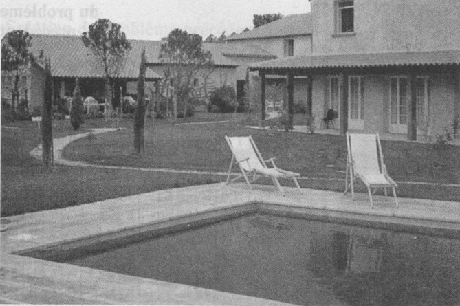
L'hôtel « Le Paradou ».

Inscriptions par écrit à Wagons-Lits Tourisme, Gare CFF, 1003 Lausanne, tél. 021/20 72 08.