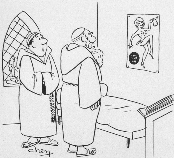
— Frère Jean dit que c'est sa nièce. (Dessin de Chen-Cosmopress)