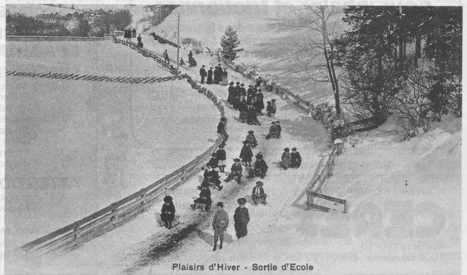
Plaisirs d'Hiver - Sortie d'Ecole

(Collection J.-P. Cuendet, 1162 Saint-Prex)