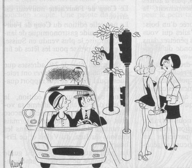
— Qu'est-ce qui t'arrive, ça fait le troisième feu vert que tu laisses passer! (Dessin de Uber-Cosmopress)