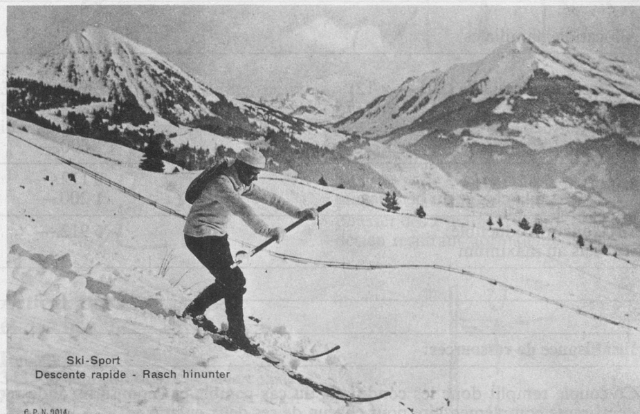
Ski-Sport Descente rapide - Rasch hinunter

Le bâton en mains était là pour permettre de freiner, entre les jambes, et de mieux terminer une majestueuse arabesque.