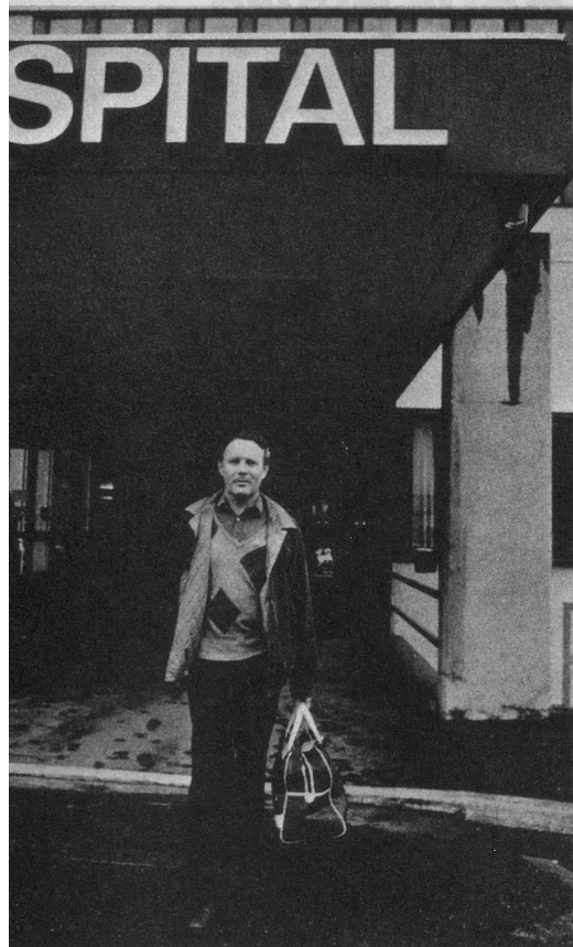
« Quelles sont mes chances d'avenir? » C'est la question qu'on se pose en sortant de l'hôpital après un infarctus.

Lorsque la Fondation suisse de cardiologie déclare que la majorité des personnes ayant subi un infarctus du myocarde reprennent plus tard leur activité professionnelle à temps complet, cette affirmation n'est valable qu'en période de plein emploi. Dans les secteurs frappés par la récession, la réinsertion professionnelle de ces patients peut être plus difficile, même s'ils appartiennent à la catégorie de risques la plus favorable.