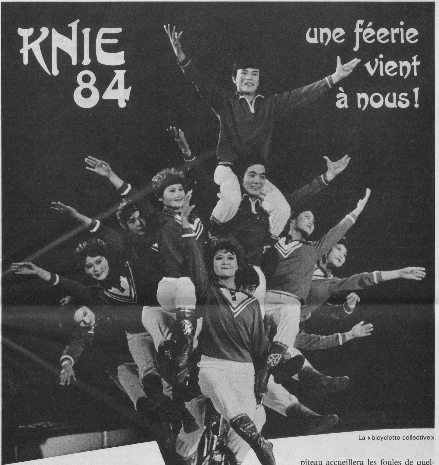
La « bicyclette collective ».