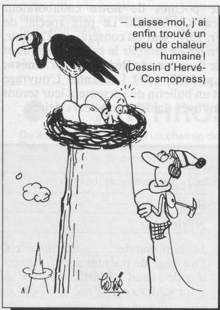
— Laisse-moi, j'ai enfin trouvé un peu de chaleur humaine! (Dessin d'Hervé-Cosmopress)