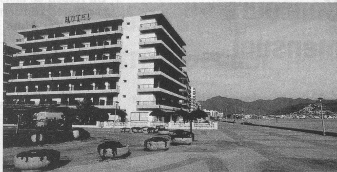
Hôtel Monte-Carlo Rosas