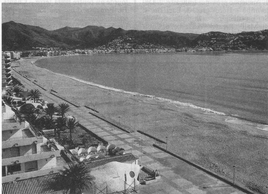
La plage de Rosas.

Pour remplacer nos précédents séjours à Salou à la suite de la vente de l'hôtel qui a accueilli nos voyageurs pendant