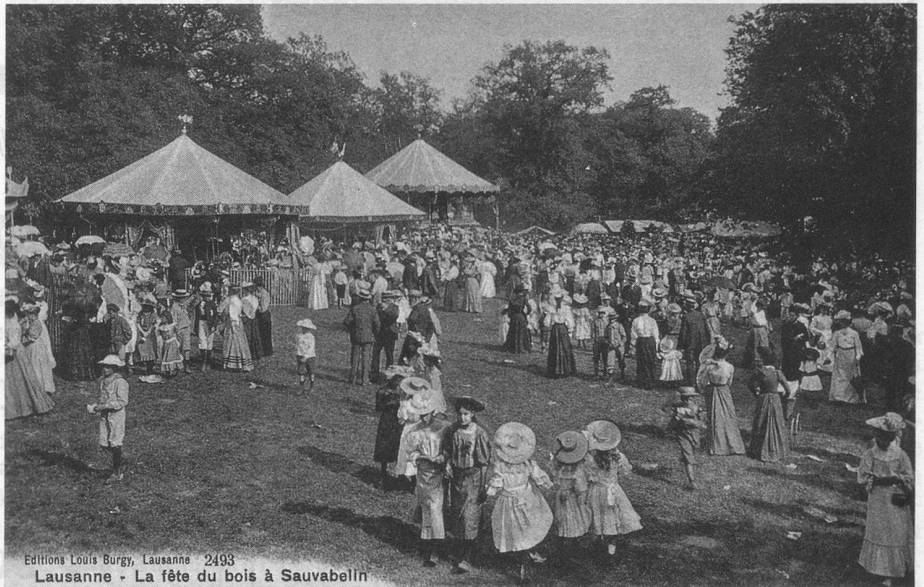
Editions Louis Burgy, Lausanne - 2493 Lausanne - La fête du bois à Sauvabelin

C'est aux manèges d'enfants que j'en ai aujourd'hui. Bien moins compliqués qu'aujourd'hui, ils sont liés à nos souvenirs de jeunesse de la période des examens et de fin de scolarité. Bien sûr, il y avait aussi des manèges d'adultes que l'on rencontrait surtout dans les parcs d'attractions: leur complexité technique interdisait généralement de les démonter et remonter chaque semaine. Et puis, il n'y avait pas