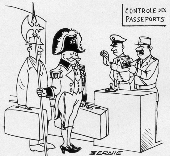
— Vous êtes Suisse à l'église Saint-Honoré et vous osez vous présenter avec un passeport français? (Dessin de Bernie-Cosmopress)