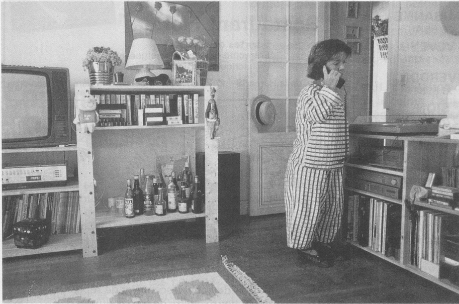
Le téléphone apporte parfois de bonnes nouvelles.