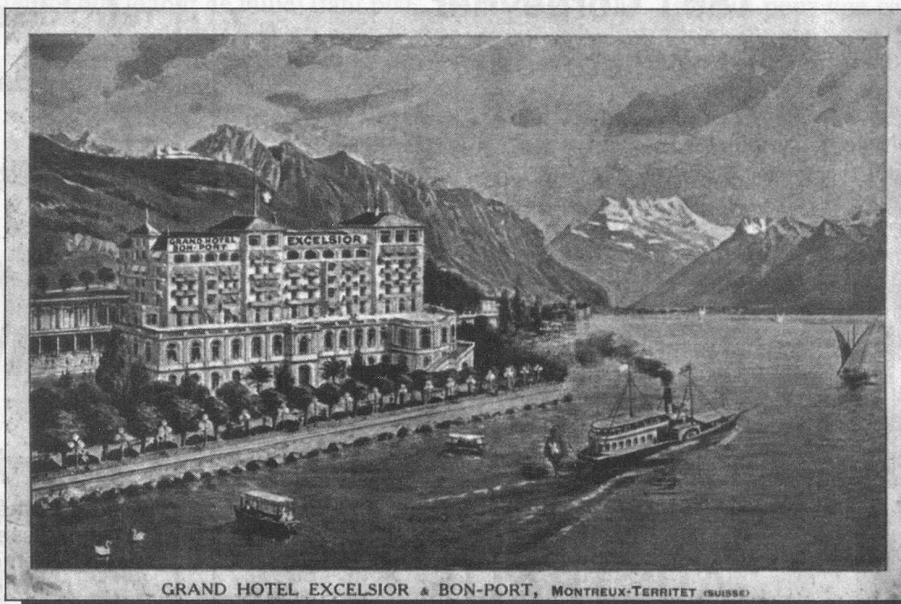
GRAND HOTEL EXCELSIOR & BON-PORT, MONTREUX-TERRIET (SUISSE)

Si nos aînés se rappellent parfaitement la vocation traditionnellement touristique d'innombrables stations romandes maintenant oubliées, les jeunes générations ne savent plus que des localités comme St-Cergue, Les Avants, Salvan, Evolène, Montbarry près de Bulle ou Chaumont, par exemple, attiraient d'innombrables étrangers et étaient équipées pour le tourisme, au début du siècle.