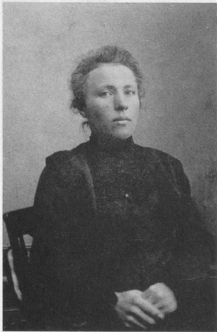
La maman: un courage indomptable