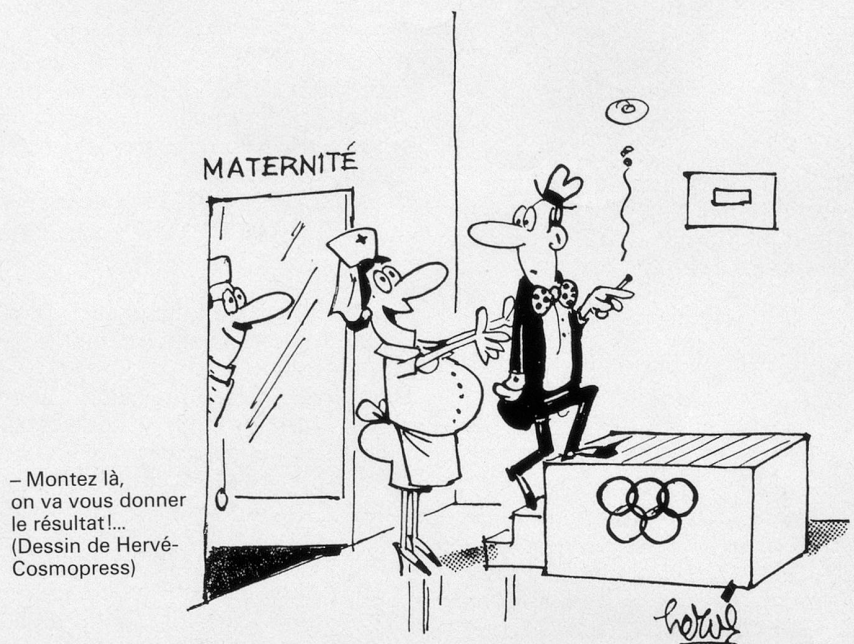
— Montez là, on va vous donner le résultat!... (Dessin de Hervé-Cosmopress)

Ne pas utiliser ce coupon pour le renouvellement de l'abonnement svp.