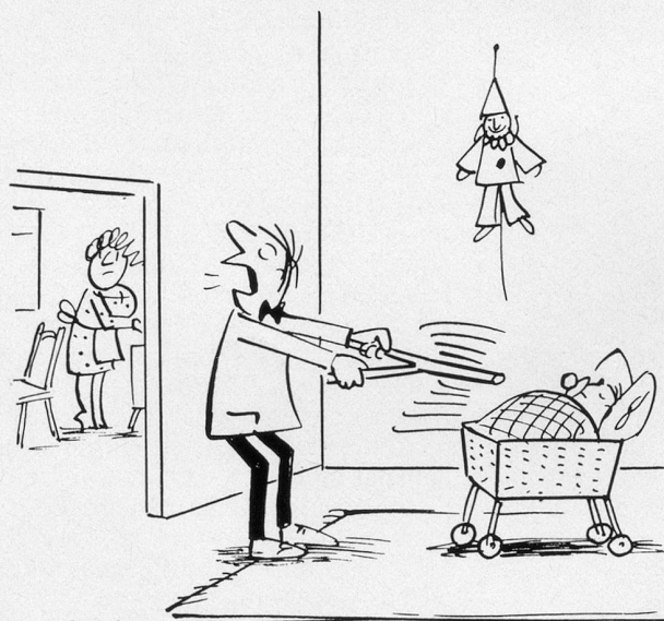
— Charlotte il est de nouveau mouillé! (Dessin de Lippisch-Cosmopress)