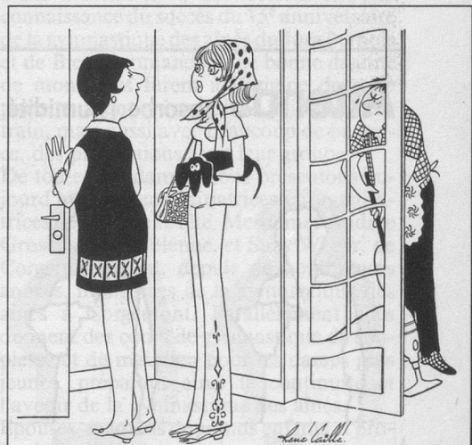
— Bien sûr que ton père fait la grève! Il ne manque jamais une occasion d'arrêter le travail! (Dessin René Caille-Cosmopress)

«Aînés» renseigne et divertit. Faites-le connaître autour de vous!