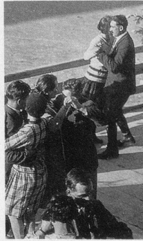
LES PORTES DE L'AUTOMNE

JACQUES-HENRI LARTIGUE, LE MAGICIEN D'OPIO