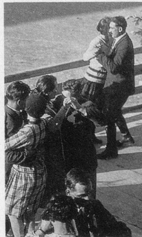
LES PORTES DE L'AUTOMNE

JACQUES-HENRI LARTIGUE, LE MAGICIEN D'OPIO