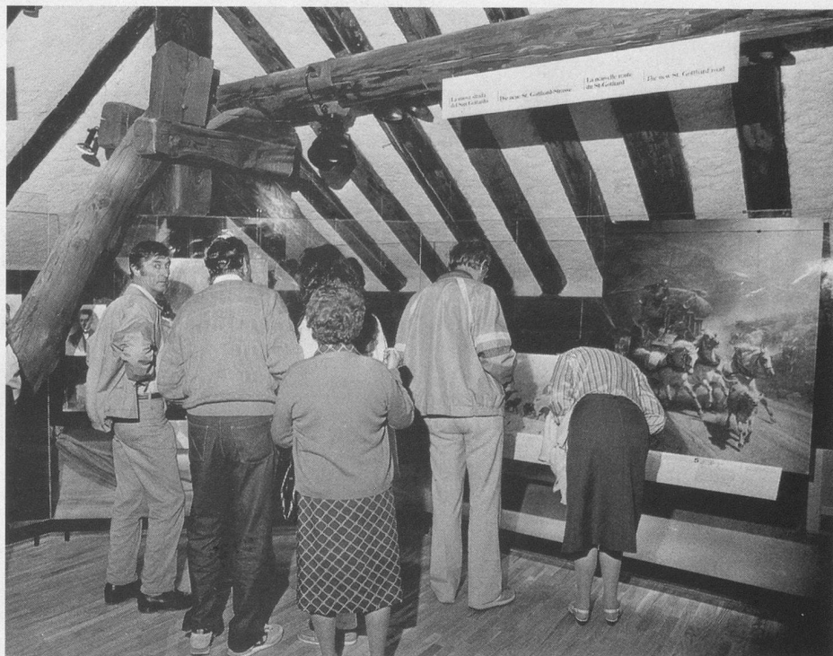
C'est dans ce local, sous un toit historique, que la multivision attire la foule des visiteurs: spectacle passionnant.

Voyager en diligence avait du charme... Aujourd'hui les tunnels ferroviaires et routier sont très actifs, mais ils n'ont pas vaincu la route magnifique qui grimpe à l'assaut du col.