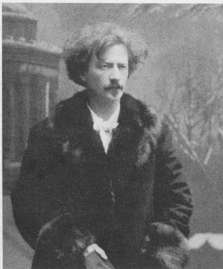
Paderewski à l'époque de la Grande Guerre

taires de l'Eglise et de l'Etat, le chant de la Rota (le serment), «l'hymne provocant des Polonais en Prusse», fut chanté avec toute la ferveur qu'il avait suscitée septante ans plus tôt lorsqu'il retentit pour la première fois en public le jour où Paderewski dévoila le monument commémorant la bataille de Grünwald: