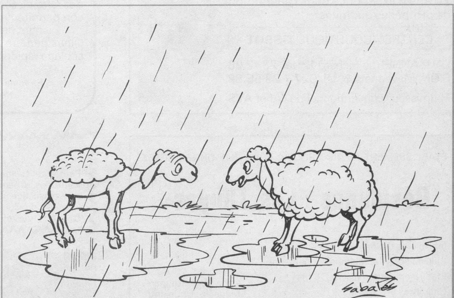
Si ça rétrécit, cela prouve que ta laine n'est pas de bonne qualité. (Dessin de R. Sabatès)