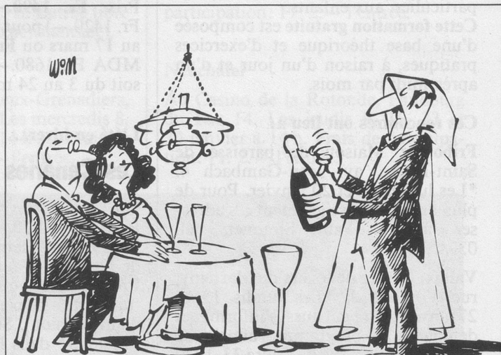
Sans paroles (Dessin de Moese-Cosmopress)

Monsieur 79 ans serait heureux de rencontrer dame 65-70 ans pour amitié et sorties , région Fribourg et environs. Ecrire sous chiffre 1747, «Aînés», Lausanne.