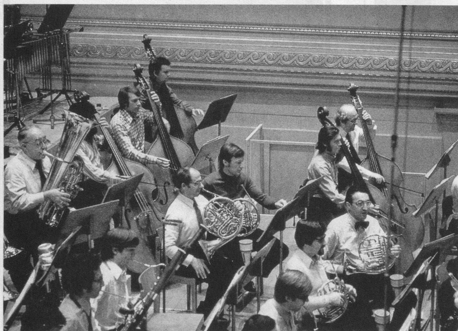
Concert «relax» de l'Orchestre symphonique de Berne, sous la baguette de Charles Dutoit. En chemise, on joue «West Side Story» de L. Bernstein, et «Un Américain à Paris» de G. Gershwin (novembre 1973).

On le voit, les tracs diffèrent et celui de Keilberth n'était pas de même qualité que celui de Rubinstein!