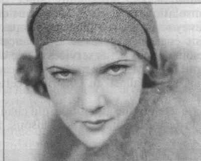
L'actrice Elissa Landi.