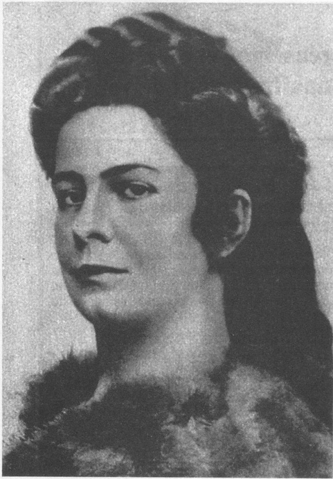
L'impératrice Elisabeth d'Autriche.

provoquer son entourage. Elle irrita la Cour en organisant des bals dans ses appartements, sans inviter les mères des jeunes filles comme il était d'usage. Elle dansait avec une fougue qu'on ne lui avait jamais connue et, quand elle participait à des bals privés, elle ne rentrait au palais qu'à des heures peu protocolaires.