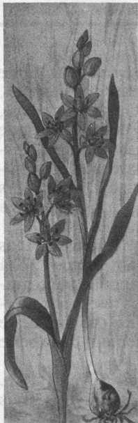
Nivéole Leucojum vernum (Amaryllidées)