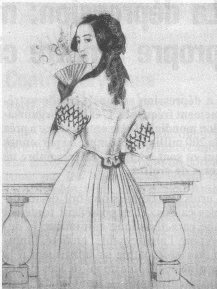
George Sand dessinée à Venise par Alfred de Musset (Bibliothèque Spoelberch, Chantilly)

Dans notre jeunesse, nous lisions les romans de George Sand, La petite Fadette ou François le Champi , dont nos maîtres nous faisaient admirer la pro-