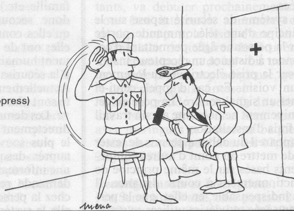
Sans paroles (Dessin de Raynaud-Cosmopress)