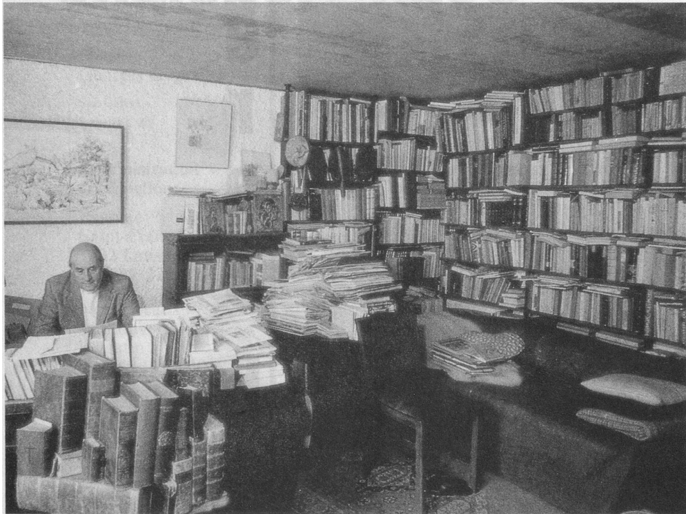
La chambre à coucher du pasteur...