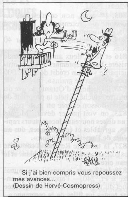
— Si j'ai bien compris vous repoussez mes avances... (Dessin de Hervé-Cosmopress)

D'ailleurs, il faut bien s'y habituer: chaque fois que les ministres européens se réunissent, ils doivent s'entendre sur une cote plus ou moins bien taillée. Il faut faire des compromis. C'était le cas quand ils étaient six, ce sera encore bien davantage le cas depuis qu'ils sont douze. Toutes les fois qu'un problème pénible se pose, il y a