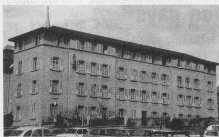
Le Grand Séminaire.

Le Grand Séminaire de Sion proche de l'évêché, qui a formé des générations de prêtres, est plus ou moins libre depuis le départ des séminaristes à Fribourg. Il abrite actuellement des réfugiés et des pensionnaires du Home Saint-Alexis. Depuis de longs mois, des consultations ont eu lieu auprès de différents organismes dont Pro Senectute, en vue de la création d'une Maison-Foyer, médicalisée, de 50 lits environ au Grand Séminaire. La commune de Sion, sur la base du rapport «Politique de la vieillesse», du mois de juin 1985, soutient cette initiative privée apportant une solu-