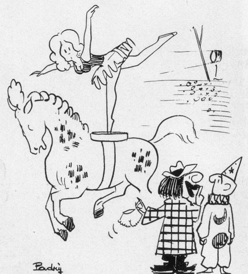
— Dis rien!... J'y fait croire qu'elle l'a oubliée! (Dessin de Padry-Cosmopress)