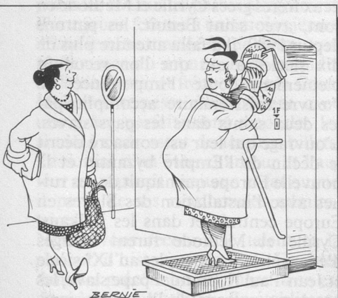
Sans paroles. (Dessin de Bernie-Cosomopress)

Juillet-août-septembre sont les mois de pointe à la campagne pour les morsures de ces acariens parasites du mouton, du chien et de l'homme. Des études menées à Rennes et à Paris, sur 154 cas entre février 1985 et février 1986, révèlent que si la phase primaire est anodine (légère inflammation autour de la piqure), il ne faut pas la négliger car elle peut être suivie, quelques semaines ou mois plus tard, par une paralysie faciale, des douleurs des racines nerveuses, une encéphalite. Les antibiotiques sont efficaces.