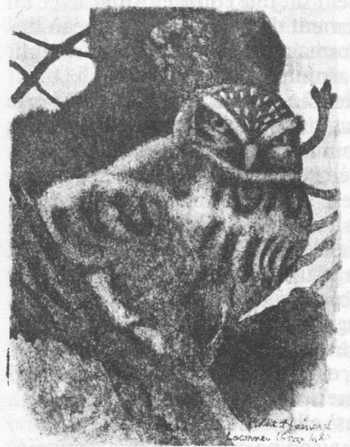
Chevêche dans le noyer. Gravure sur bois. en couleurs de Robert Hainard.