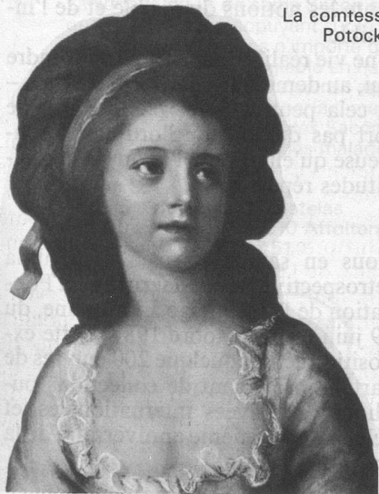
La comtesse Potocka

Dans le livre de Marie-Claire Hoock-Demarle, il ne s'agit cependant qu'en passant des femmes qui jouèrent un rôle dans la vie du grand écrivain allemand. L'ouvrage traite avant tout des conditions de la femme à son époque, c'est-à-dire entre le milieu du XVIII e siècle et le début du XIX e , une époque cruciale pour ce qu'on appelle aujourd'hui l'émancipation de la femme. Comment vivaient en ce temps-là les grandes dames de l'aristocratie comme cette ravissante comtesse Potocka, épouse d'un général allemand qui figure sur la couverture de l'ouvrage? Quels étaient les champs d'activité de la femme au foyer, de la paysanne, des domestiques, des riches et des pauvres? Autant de chapitres d'une étude enrichissante sur la condition de la femme et son évolution, suivie de loin, semble-t-il, par le «vieux Goethe», trop absorbé sans doute par sa production littéraire.