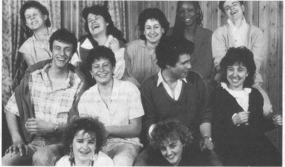
Des jeunes, cœur ouvert, sans idées préconçues.