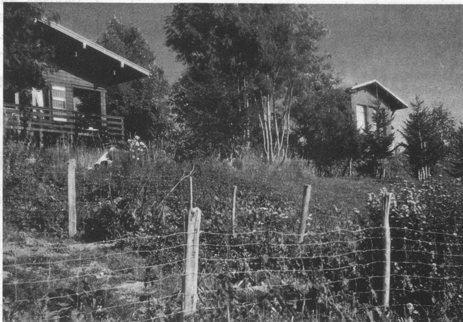
Les fils de fer barbelés de la liberté: la clôture du jardin. A gauche, le chalet du jardinier des alpages.

Elle leur fait ramasser des airelles rouges, mais pas des « airelles des marais » couleur bleu de Prusse, le cornouiller mâle aux olives jaune-orange et rouge bordeaux, mais pas le cornouiller rouge sang aux petits fruits vénéneux, les baies rouge vermillon des sorbiers, assez acidulées pour attirer les enfants autant que les pinsons, les perles jaune or ou orange des argousiers de la mi-