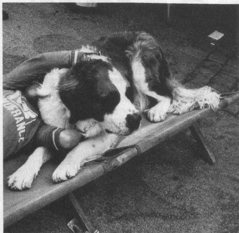
Après l'exercice, le repos.