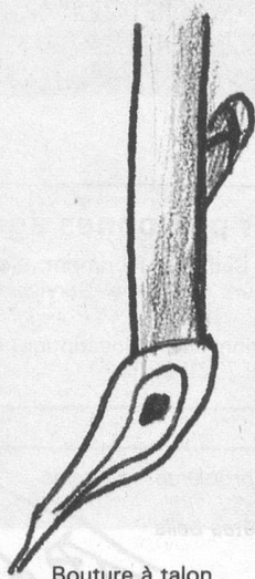
Bouture à talon

auparavant: fumier en granulé macéré dans de l'eau en égale quantité. Ajoutez 5 cm de tourbe, puis recommencez jusqu'à ce que le sac soit plein. Versez un arrosoir d'eau avant de refermer. Début décembre, vous pourrez utiliser ce compost aux pieds de vos rosiers. Si le gazon n'est pas entièrement décomposé, l'hiver se chargera de le défaire d'ici le printemps.