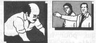
Arthrose, arthrite, rhumatisme, douleurs dans les épaules et la nuque, douleurs musculaires.

prolongé, il représente la possibilité de diminuer l'emploi et la quantité de médicaments qui, dans certains cas, deviennent difficiles à supporter.