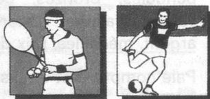
Tendo-vaginite des joueurs de tennis, blessures du sport, massages.

L' Onguent Melbrosin-Propolis est une préparation principalement à base de propolis, un mastic résineux que les abeilles produisent pour protéger leurs provisions des bactéries et des virus, mais qui, dans cette préparation, peut être aussi très utile aux hommes. Tandis qu'elle exerce une action analgésique par les substances aromatiques et les esters qu'elle contient, les baumes et les composants phénoliques luttent contre l'inflammation. Ainsi le D r W. Salomon rapporte des cas d'arthrose de l'articulation du genou, de tendo-vaginites des joueurs de tennis, de tendinites, etc, dans lesquels le traitement avec l' Onguent Melbrosin-Propolis s'est avéré excellent.