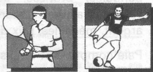
Tendo-vaginite des joueurs de tennis, blessures du sport, massages.