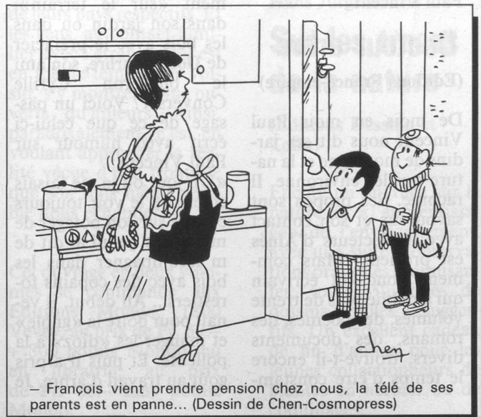
– François vient prendre pension chez nous, la télé de ses parents est en panne... (Dessin de Chen-Cosmopress)