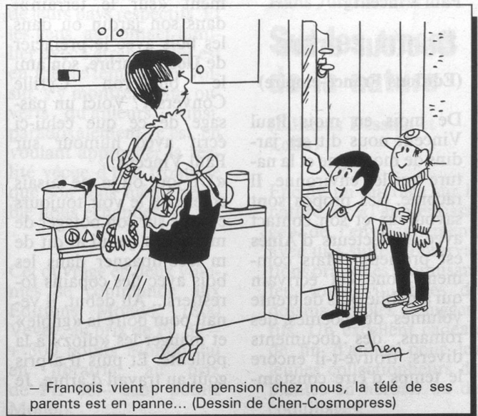
– François vient prendre pension chez nous, la télé de ses parents est en panne... (Dessin de Chen-Cosmopress)