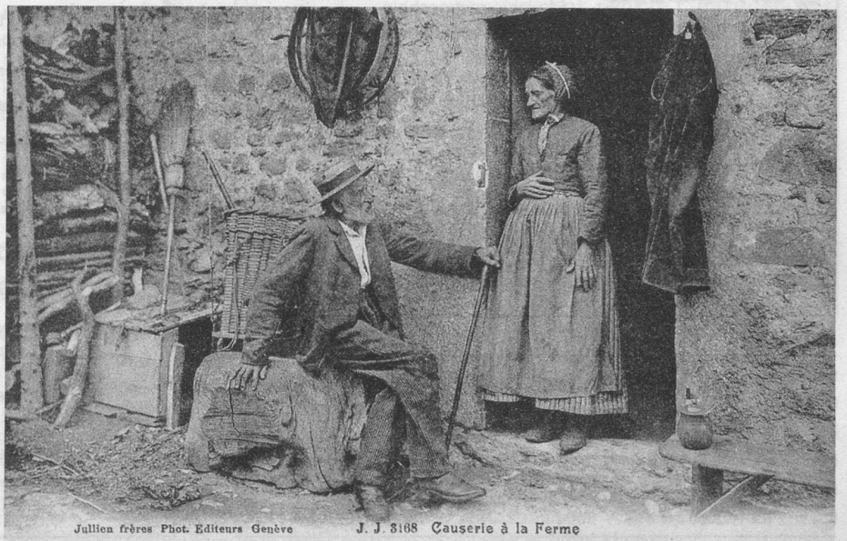
Julien frères Phot. Editeurs Genève

(Cartes extraites de la collection de M. J.-P. Cuendet, rue de la Gare 1, 1162 St-Prex).